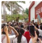
Lea También: Protestas en dos colegios de Puerto Wilches por falta de docentes

Cabe recordar que pese a los efectos de la pandemia por la propagación de la covid -19, Ecopetrol reportó un récord histórico durante el 2021 al alcanzar una utilidad neta de 16.7 billones de pesos, cifra diez veces superior a la del 2020.