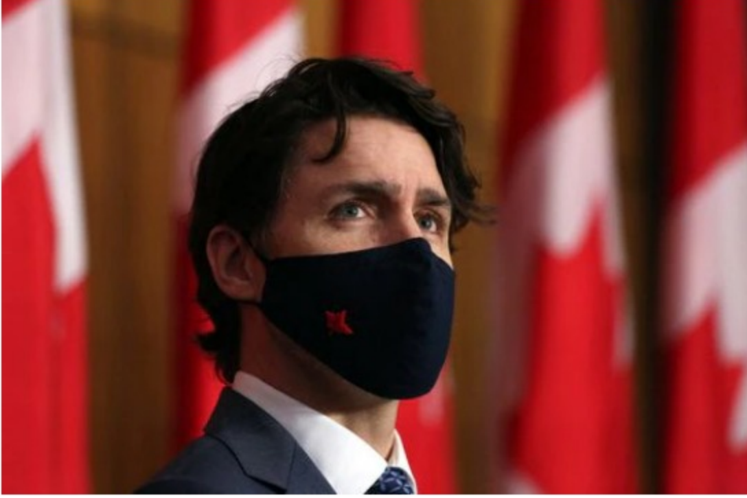
Justin Trudeau, primer ministro de Canadá.