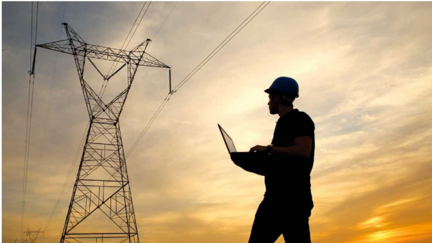
En el Registro Único de Prestadores de Servicios Públicos Domiciliarios (RUPS) están inscritos 286 de energía.

Finalmente, según los reportes de las empresas, el servicio de gas combustible por redes cuenta con 10.099.603 suscriptores, de los cuales 9.949.824 son atendidos por 139 empresas, mientras el servicio de GLP en cilindros y tanques es prestado por 93 compañías.