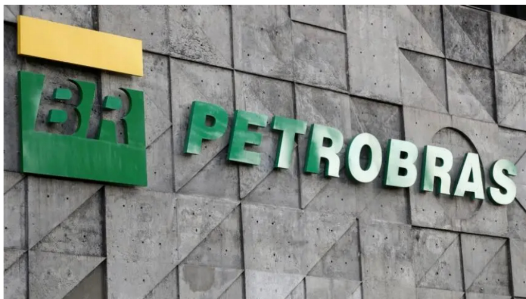
signo de petrobras

Los últimos días, marcados por la invasión de Rusia a Ucrania, han marcado nuevos récords en el precio del Petróleo . El miércoles (23), el precio del barril tipo Brent para abril superó los US$ 105, pero luego retrocedió, cerrando en US$ 94,12, ante las perspectivas de que las sanciones de los aliados occidentales a Rusia salvarían el sector energético del país. .