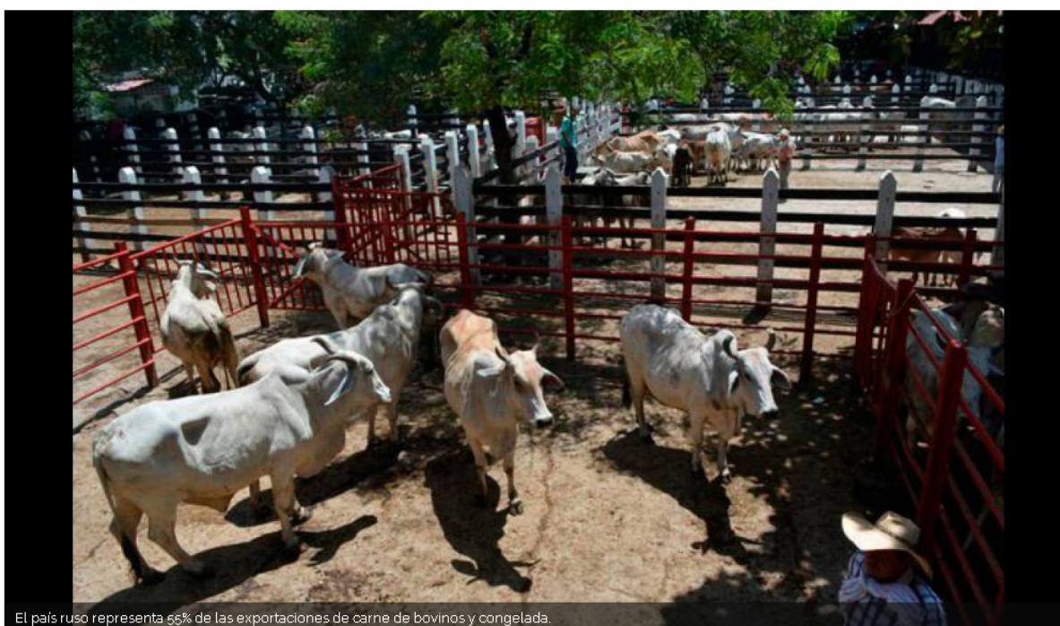
El país ruso representa 55% de las exportaciones de carne de bovinos y congelada.

Expertos afirman que las posibles rupturas comerciales con Rusia afectarían la comercialización de ciertos productos de la industria agropecuaria.