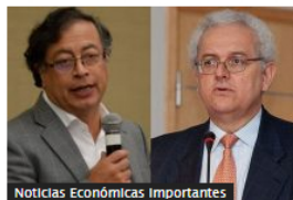
Noticias Económicas Importantes

José Antonio Ocampo aceptó ser ministro de Hacienda de Colombia