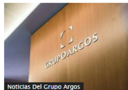
Noticias Del Grupo Argos

S&P confirma calificación de Ecopetrol ; habla de Petro y planes a largo plazo