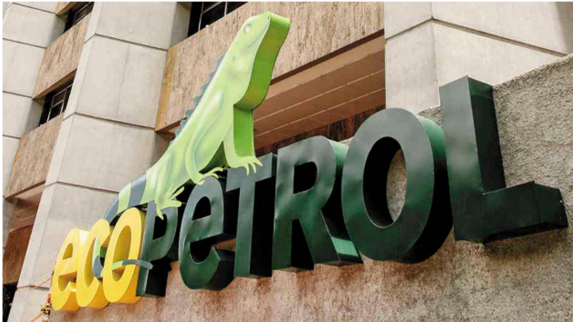
El título de la petrolera colombiana registra una disminución de sólo $8 frente al precio de cierre de este martes.

Aunque parecía que poco a poco la acción de Ecopetrol estaba recuperando su valor en la Bolsa de Valores de Colombia y se acercaba a los 2.400 pesos, este miércoles volvió a estar en rojo, como pasó durante varios días después de la elección de Gustavo Petro como nuevo presidente del país, el pasado 19 de junio.