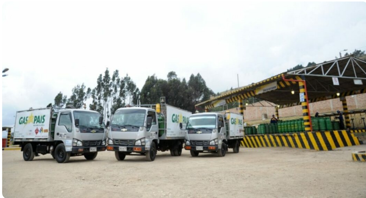
Gas GLP en Colombia incrementaría.