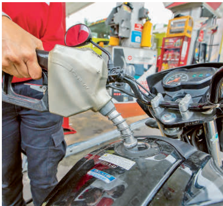
Chevron con su marca Texaco posee 475 estaciones de servicio y posee el 10% de participación en el mercado en el país.

La tercera empresa con participación es Chevron con