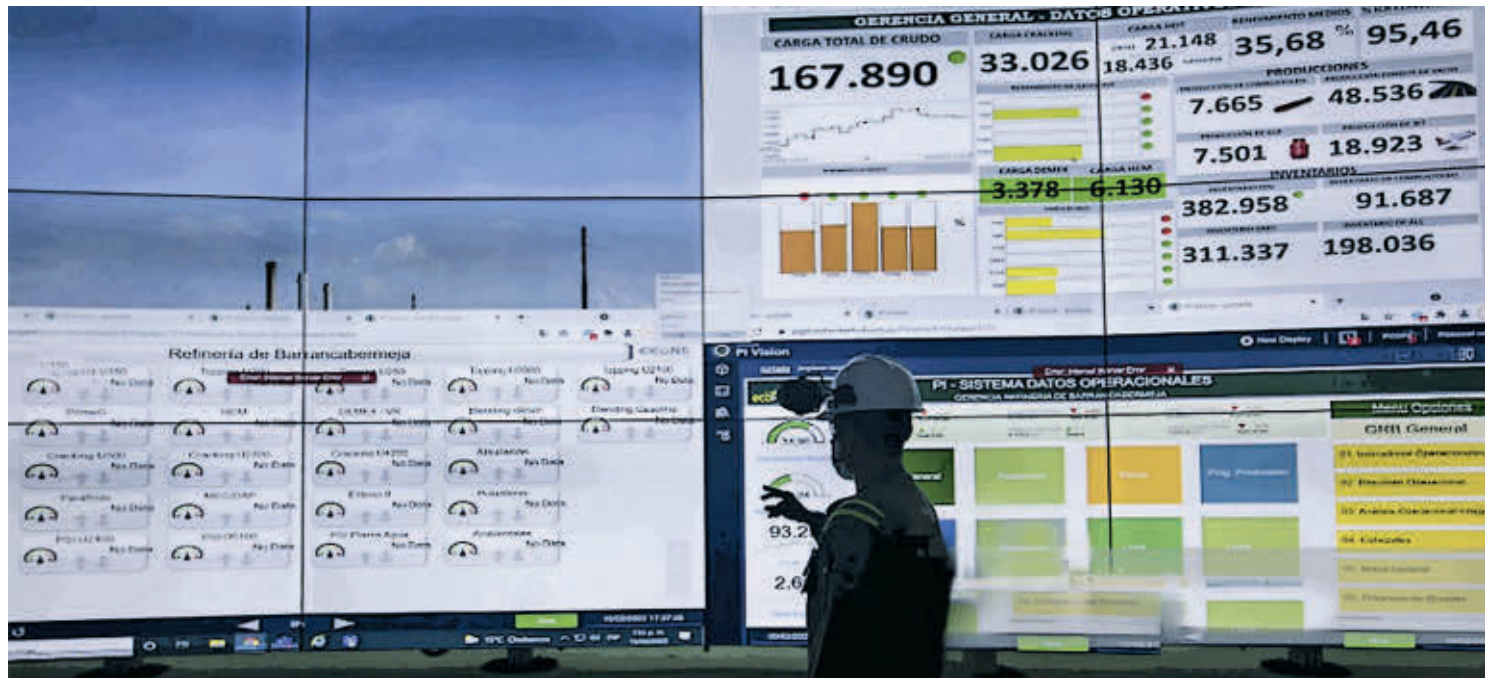
La acción de la compañía de la iguana cerró ayer a $2.379, en la Bolsa de valores de Colombia.

Mientras tiene al mercado a la espera de su gabinete, el presidente electo Gustavo Petro dijo en días pasados que su propuesta se ha tergiversado, pues el cierre del grifo petrolero en Colombia será gradual y no el 7 de agosto.