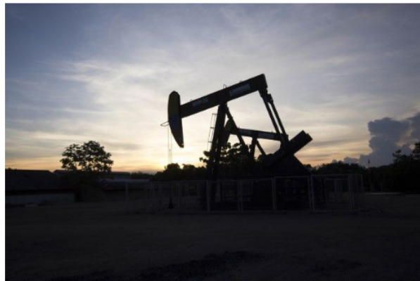
La elección de Petro podría tener un impacto significativo en la industria petrolera del país, que ya se encuentra en dificultades.

El candidato izquierdista, el senador Gustavo Petro, salió victorioso de la segunda vuelta presidencial de Colombia en junio como presidente electo del país devastado por los conflictos. El 7 de agosto de 2022, Petro asumirá el