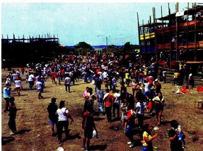
La estructura de guadua de 15 palcos se vino al piso, a las 12:45 p. m. de ayer, con más de 200 personas.

En el marco de las celebraciones del Día Internacional del Orgullo LGBTIQ+, que será este martes, el Dane encontró que esta población tiene un nivel educativo ligeramente superior, pues el 24,4 por ciento de las 301.436 personas representativas son profesionales o tienen estudios de posgrado, frente a un 20,2 por ciento de los no LGBT. A fondo / 2.7