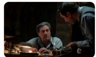
'Adiós, señor Haffmann': la ética en tiempos de guerra