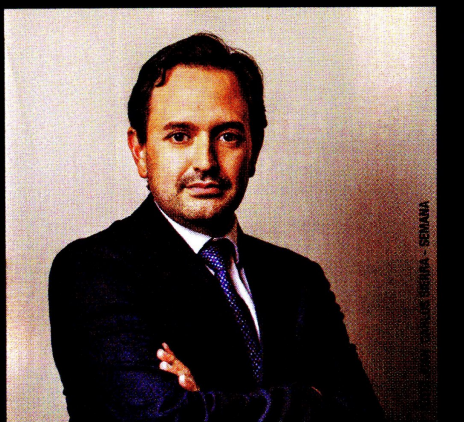
▲ Diego Mesa, ministro de Minas y Energía, dijo que 56 por ciento de la balanza comercial depende del sector de hidrocarburos.