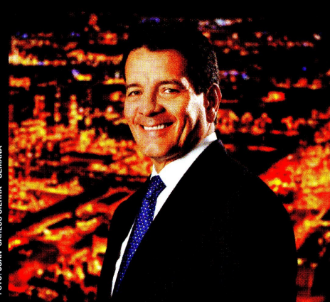
▲ Felipe Bayón, presidente de Ecopetrol, entregó el año pasado resultados históricos para la empresa en ingresos y utilidades.

por el peor escenario: “Si la industria del petróleo es un enemigo público, hay preocupación porque el modelo de negocio de Ecopetrol se acabe y no se sepa en qué pueda terminar. Ya incluso los inversionistas preguntan si la empresa podría en el futuro no cumplir con el pago de sus deudas y hacer un default ”, señala.