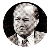
Amylkar Acosta Ex ministro de Minas y Energía

“Ecopetrol, con sus directivos, deben procurar tener una relación sana en materia institucional con el nuevo Gobierno. Está en juego la reputación de la petrolera”.