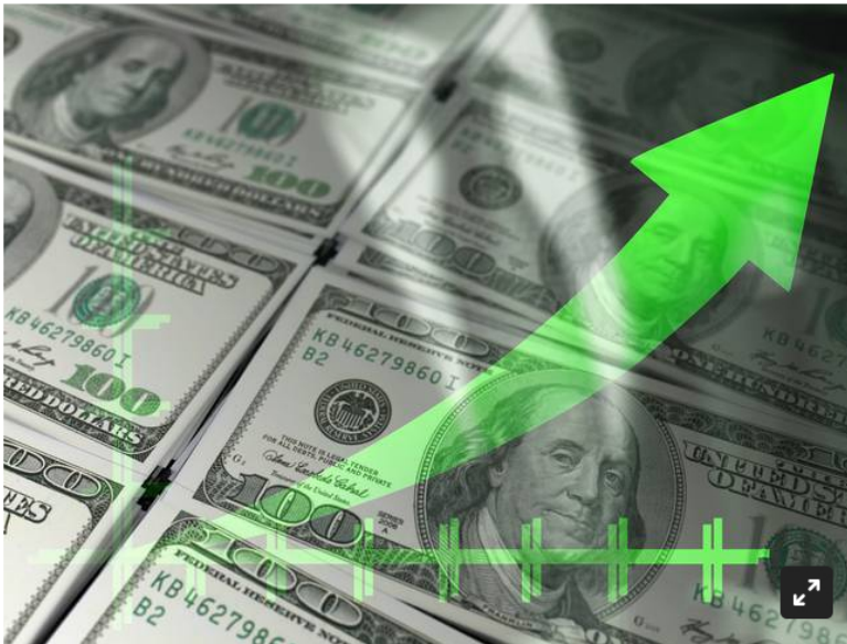
Imagen de referencia de economía mundial.

La divisa estadounidense cerró a un precio promedio de $4.068,60, con un alza de $42 frente a la TRM.