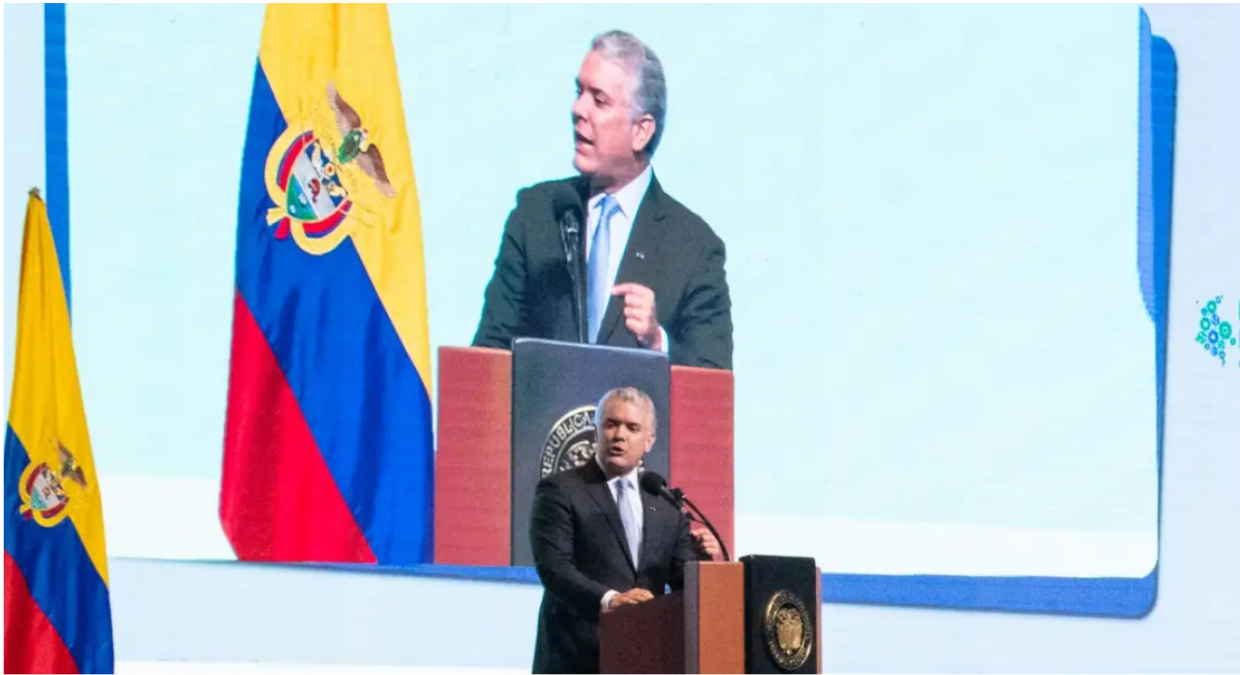
Sin mencionar a Petro, Duque critica su propuesta sobre el gas.

Como un "error" ha calificado el presidente Iván Duque la posibilidad de que Colombia llegue a depender del gas proveniente de Venezuela , producto de "espantar" la inversión extranjera directa en materia minero energética.