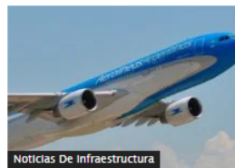
Noticias De Infraestructura

Crecimiento del consumo en Colombia, prioridad del Comité de Seguimiento a Sistema Financiero