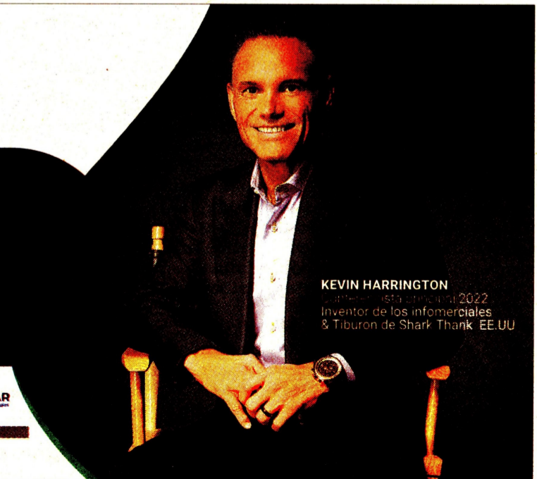
KEVIN HARRINGTON Inventor de los infomerciales & Tiburon de Shark Tank EE.UU.