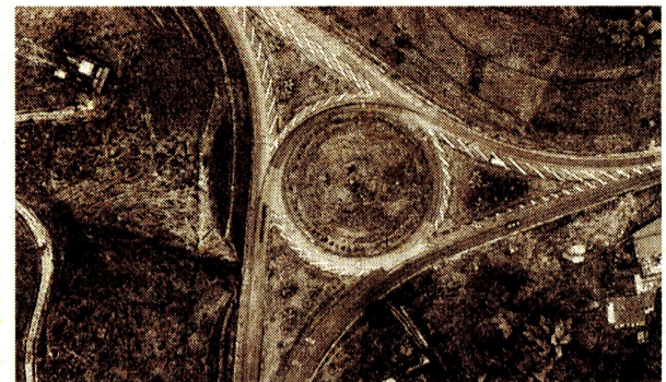
Proyecto de Autopista del Café hace parte del fondo.

Ayer la mayoría de bolsas latinoamericanas y las de EE. UU. retrocedieron.