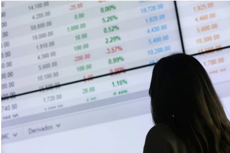
Foto de archivo. Un operador trabaja en el piso de la Bolsa de Valores de Colombia, en Bogotá, Colombia 1 de febrero de 2019. REUTERS/Luisa González

¿Realmente Ecopetrol perdió el 21 de junio $15 billones? Esa pregunta se la hicieron muchos colombianos tras conocer la noticia que agitó el mercado, pues se informó que cada una de sus acciones cayó un 13 % en la Bolsa de Valores de Colombia ante el temor de la reducción de la actividad petrolera en el país anunciado por el presidente electo, Gustavo Petro.