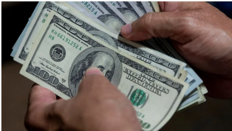
Fotografía de archivo de un fajo de billetes de dólares.

Tras la elección de Gustavo Petro como nuevo presidente de los colombianos, el pasado 19 de junio , economistas y expertos, así como ciudadanos preocupados por el futuro del país, han estado muy pendientes de los cambios que desde ese día se vienen presentado en el valor del dólar y las bolsas de valores que afectan la economía nacional.