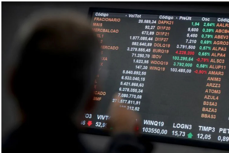
FOTO DE ARCHIVO. Los tipos de cambio del euro y el dólar estadounidense se ven en un tablero electrónico en la Bolsa de Valores B3 de Brasil, en São Paulo. 25 de julio de 2019.

Desde el pasado lunes 20 de junio, tras conocer los resultados de las elecciones presidenciales en el país que dejaron como ganador al candidato de izquierda Gustavo Petro , a nivel nacional e internacional se ha estado pendiente del comportamiento del dólar y a bolsa de valores. Todo esto con la intención de ver si la llegada de un gobierno izquierdista al país tiene un impacto positivo o negativo en estos aspectos económicos.