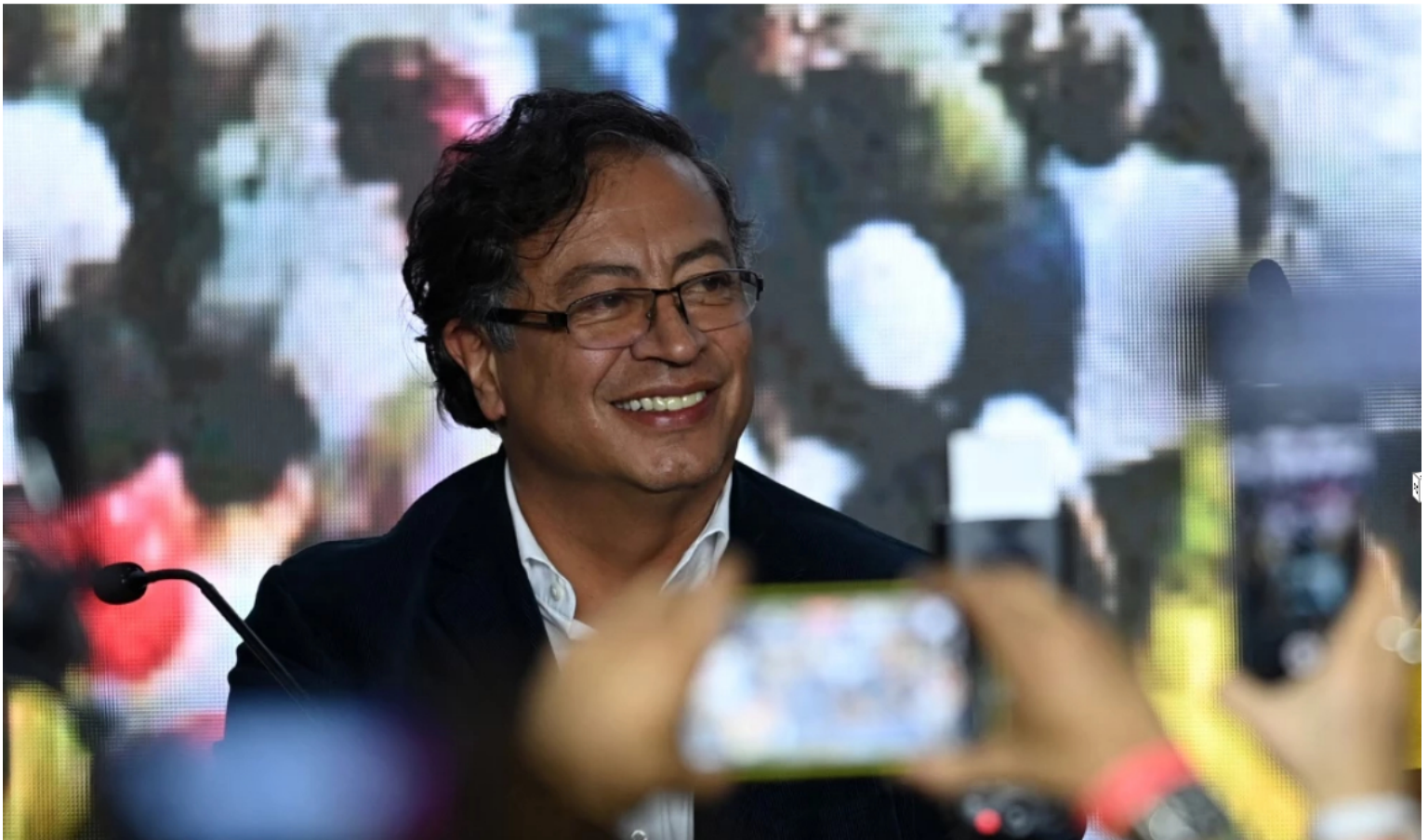
Gustavo Petro