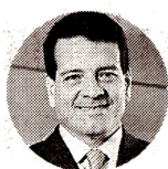
Felipe Bayón Presidente de Ecopetrol

Escanee para ver el comment en video del informe de las 1.000 empresas más grandes.