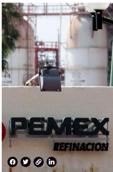
La petrolera Pemex es de México.

Algo similar ocurrió con el mercado de acciones en general. Mientras que la Bolsa de Colombia terminó con la fuerte caída de 3,8 por ciento, en Europa los mercados tuvieron ganancias, con excepción de Madrid, y el índice Euro Stoxx 50 subió 0,7 por ciento.