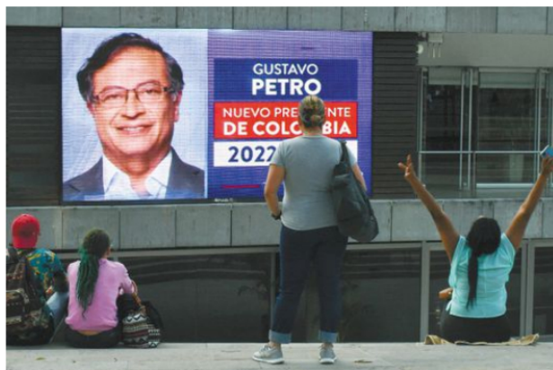
Los principales retos económicos de Gustavo Petro: arreglar la situación fiscal y generar reducciones en desigualdad.