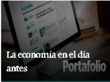
La economía en el día antes