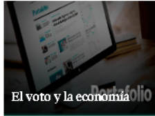
El voto y la economía