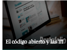
El código abierto y las TI