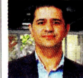
RODOLFO CORREA Presidente Consa @RodolfoCorreaV

Todos estos productos mencionados anteriormente son muy importantes en nuestra vida diaria, pero hay una actividad que depende de la petroquímica y que, además de ser importante, es vital para la existencia del orden social y económico: la agricultura. Es decir, la producción de comida.