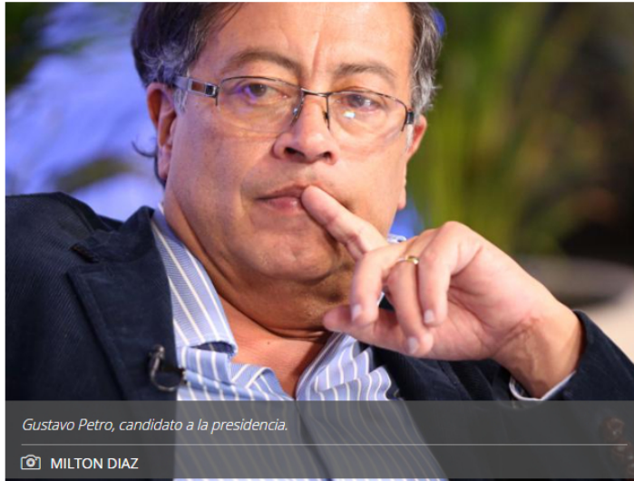
Gustavo Petro, candidato a la presidencia.

La eliminación de extracción de petróleo, reducción del IVA y condonar deuda del Ictex son algunos planteamientos del candidato presidencial.