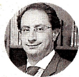
José Manuel Restrepo Ministro de Hacienda

ENERGÍA. EL MINISTERIO DE HACIENDA ESTABLECIÓ UN PLAN PARA QUE EL PAÍS ESCALE LOS PRECIOS DE COMBUSTIBLES HASTA LOGRAR EL PRECIO DE PARIDAD INTERNACIONAL