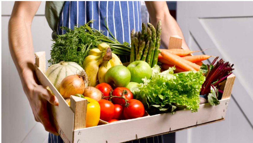
Con la gasolina a mayor precio podrían encarecerse los demás bienes y servicios.

Lo cierto es que, por ahora, los colombianos tendrán que pagar más por la gasolina y el ACPM desde junio, según se evidencia en el Marco Fiscal de Mediano Plazo, lo que, de acuerdo con la sustentación del Ministerio de Hacienda, “implicará un esfuerzo importante para el próximo gobierno”.