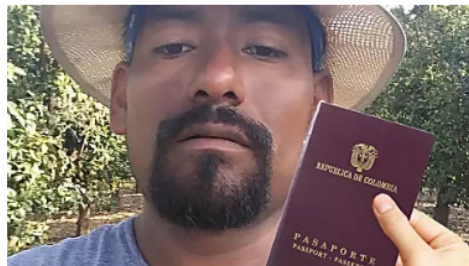
Las personas que hayan nacido entre 1941 y 1981 podrán reclamar este derecho en...