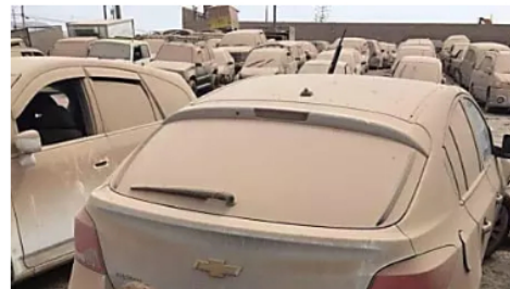
Bogotá: Autos 2021 no vendidos ahora casi regalados: ver precios

Autos | Enlaces Publicitarios | Patrocinado