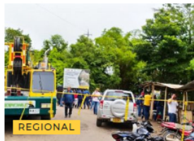
Protestan por presuntos incumplimientos de Ecopetrol en Yondó JUNIO 14, 2022