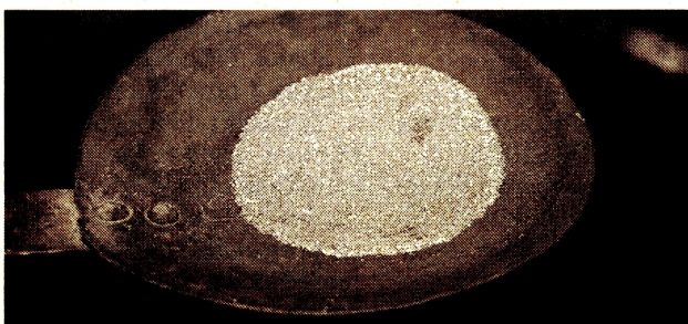
El país sigue promoviendo la inversión minera.

EL PAÍS presentó ayer cuatro prospectos para minería de oro en la Convención internacional de la Asociación de Prospectores y Desarrolladores de Canadá (PDAC, por sus siglas en inglés), considerada la feria de exploración más importante del mundo, en Toronto, Canadá.