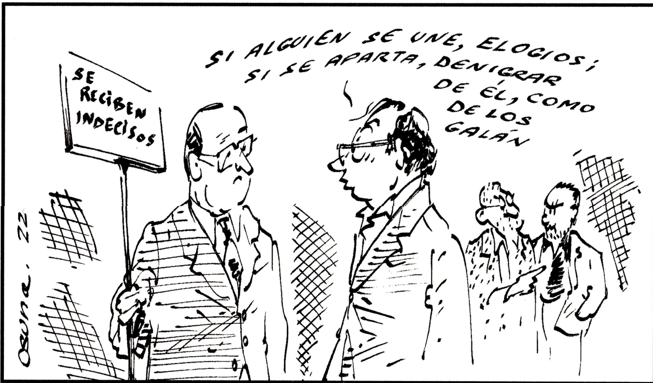
El aporte de la vieja política