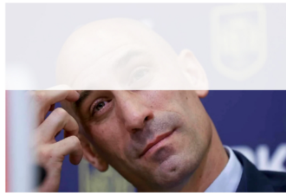
Rubiales, ante la justicia suiza por grabaciones ilícitas en la UEFA en 2019