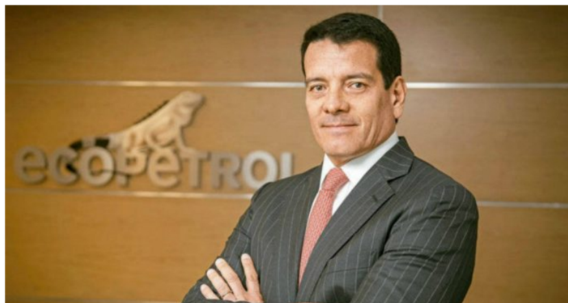
Foto: Presidente de Ecopetrol , Felipe Bayón.

La propuesta viene del Ministerio de Hacienda y Ecopetrol como parte del plan para cubrir el saldo del Fondo de Estabilización de Precios de Combustibles.