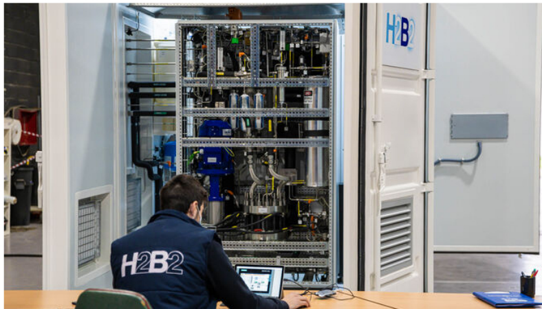
Un electrolizador construido por la startup H2B2 en sus instalaciones de Dos Hermanas.

• La petrolera colombiana quiere producir un millón de toneladas al año en el horizonte 2040