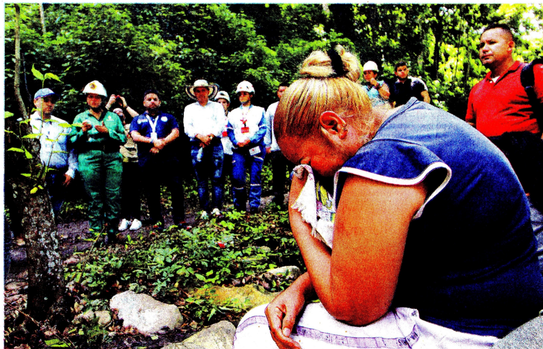
Personal de rescate y voluntarios trabajaban ayer en la vereda El Albarico de El Zulia, Norte de Santander, para intentar sacar a 14 trabajadores de la mina de carbón El Mestizo, en la que se registró una explosión el lunes. Entre tanto, se confirmó la muerte de Fabio Cáceres, quien había resultado con graves quemaduras. En la foto, familiares de las víctimas se lamentan. Este año van 32 accidentes en minas, que ya dejan 55 muertos. Información general / 2.7