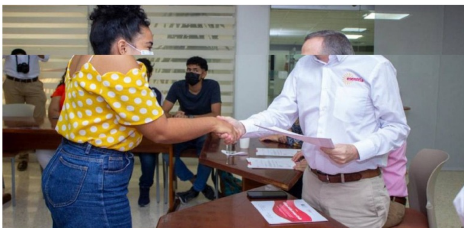
Becas / Esenttia

Estos apoyos lo recibieron estudiantes de la Universidad Tecnológica de Bolívar