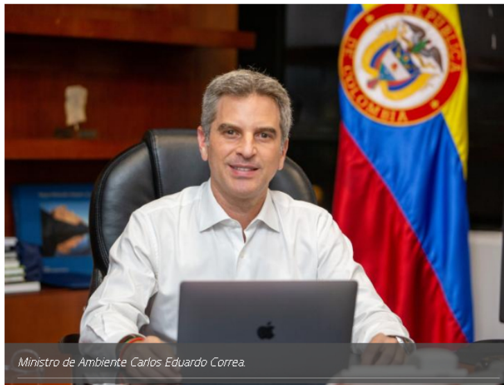
Ministro de Ambiente Carlos Eduardo Correa.

Carlos Eduardo Correa, Ministro de Ambiente y Desarrollo Sostenible, habló con Portafolio sobre el balance y los logros del ministerio para el sector.