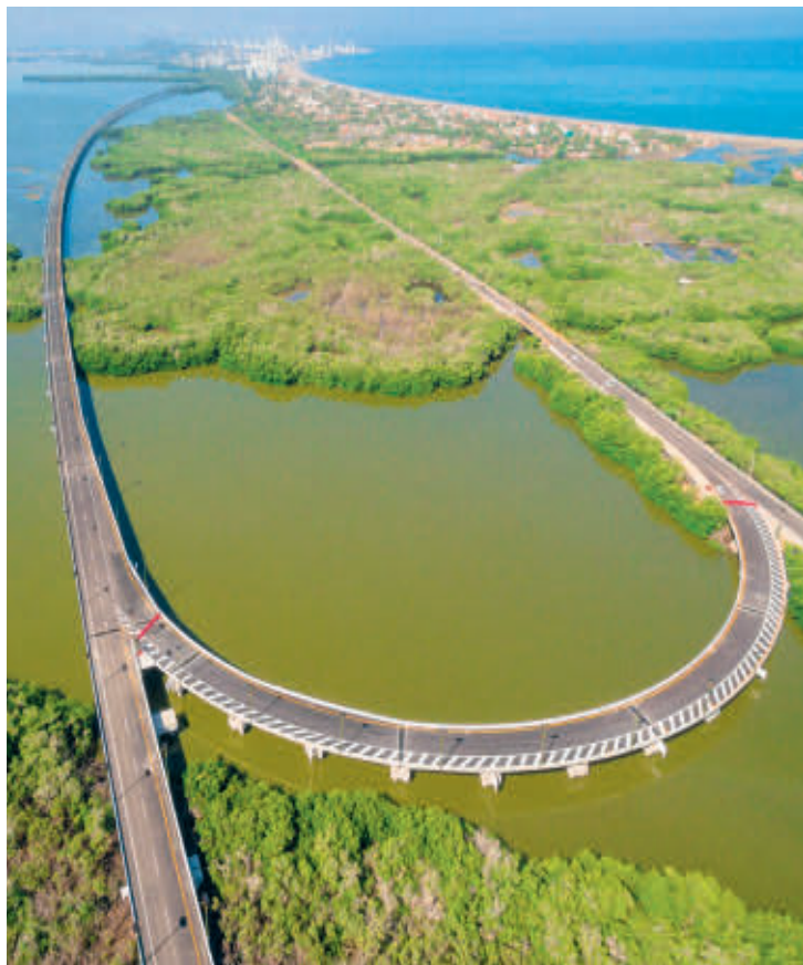
En la concesión Ruta Costera, sobresale el Viaducto El Gran Manglar sobre la ciénaga de La Virgen.

Aunque la compañía lleva poco más de 10 años de presencia en el país austral, es la