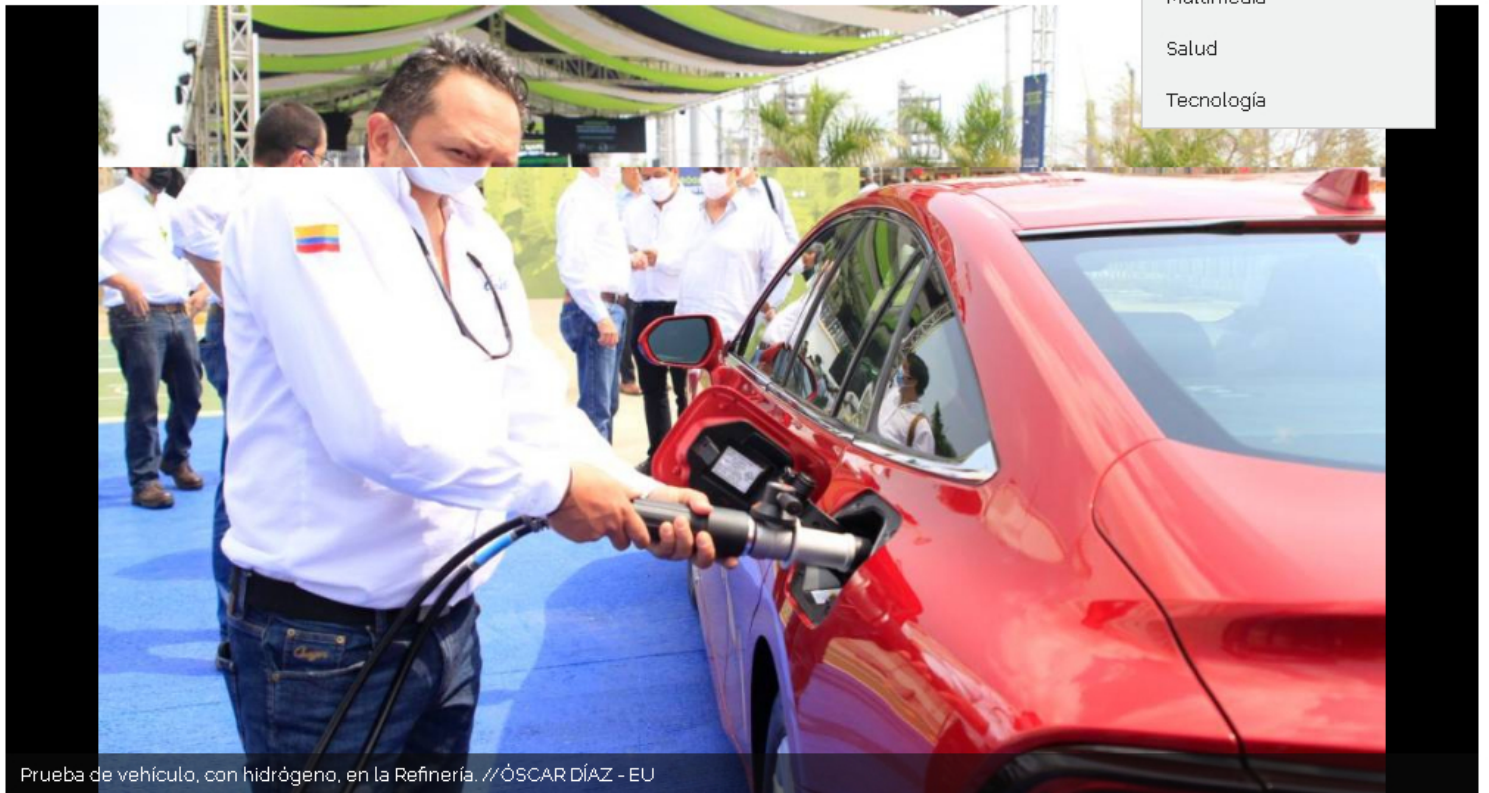
Prueba de vehículo, con hidrógeno, en la Refinería.