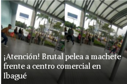
¡Atención! Brutal pelea a machete frente a centro comercial en Ibagué