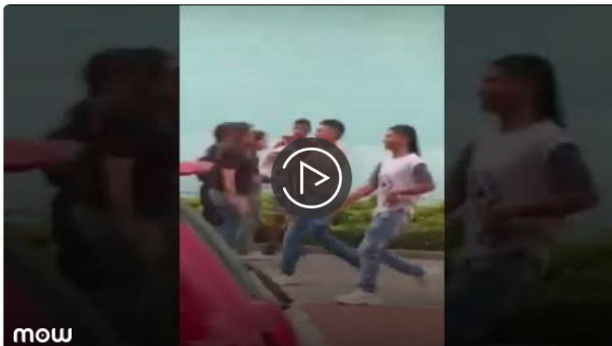
#RiñasCallejeras Se querían dar 'acero' en plena entrada de centro comercial