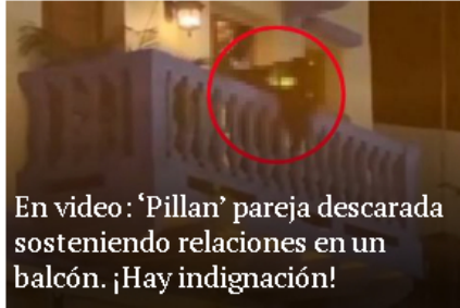
En video: 'Pillan' pareja descarada sosteniendo relaciones en un balcón. ¡Hay indignación!