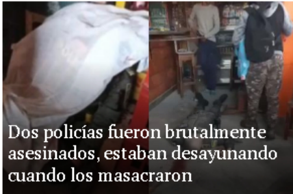
Dos policías fueron brutalmente asesinados, estaban desayunando cuando los masacraron