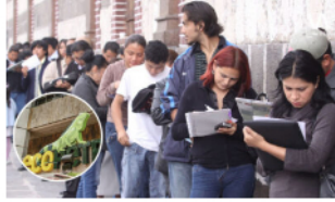
Ecopetrol abre convocatoria para ofrecer 350 nuevos empleos