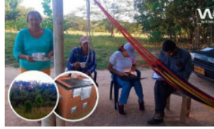
Familias rurales del Meta suscriben acuerdos para conservación de hectáreas de bosques