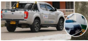
Ecopetrol aumenta flota de vehículos eléctricos en el Meta