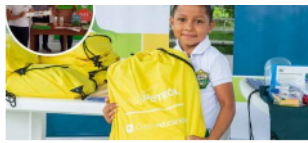
Estrategia educativa de Ecopetrol ha beneficiado a más de 57 mil niños