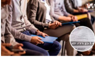
Ecopetrol amplía el plazo para postulaciones a la convocatoria laboral