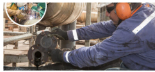
Ecopetrol generó 5.704 empleos para habitantes de Puerto Gaitán