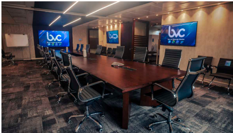
La Bolsa de Valores de Colombia abre al alza por segundo día consecutivo esta semana.

La Bolsa de Valores de Colombia mantiene el buen ritmo con el que comenzó la semana y este martes 19 de julio volvió a reportar resultados positivos, jalada por las acciones de los sectores bancario, petrolero y energético en el país, que arrancaron este día con una tendencia creciente.