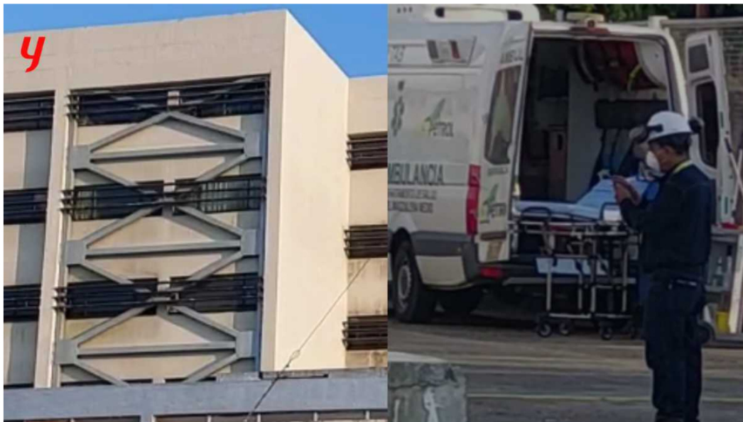
Ecopetrol indicó que no hará un pronunciamiento del hecho por respeto al trabajador y su familia.

En la tarde de este viernes 15 de julio, una emergencia se registró en el Distrito de Barrancabermeja, Santander, donde un funcionario de Ecopetrol habría intentado quitarse la vida. Las autoridades investigan este lamentable hecho.