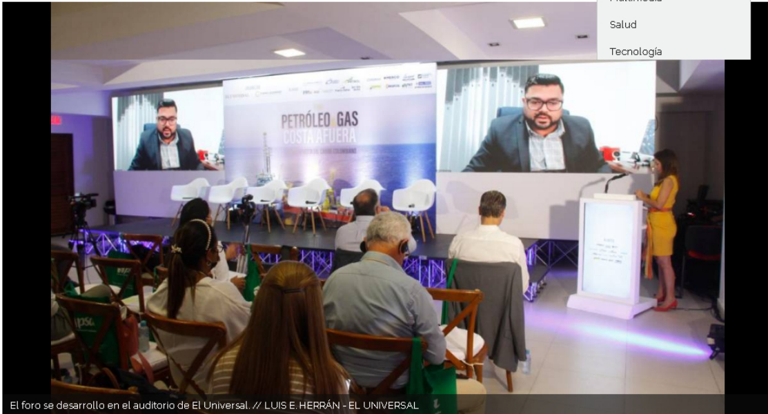
El foro se desarrolló en el auditorio de El Universal.

Cámara de comercio de la región trabajarán para hacer del Caribe colombiano un hub de operaciones offshore.