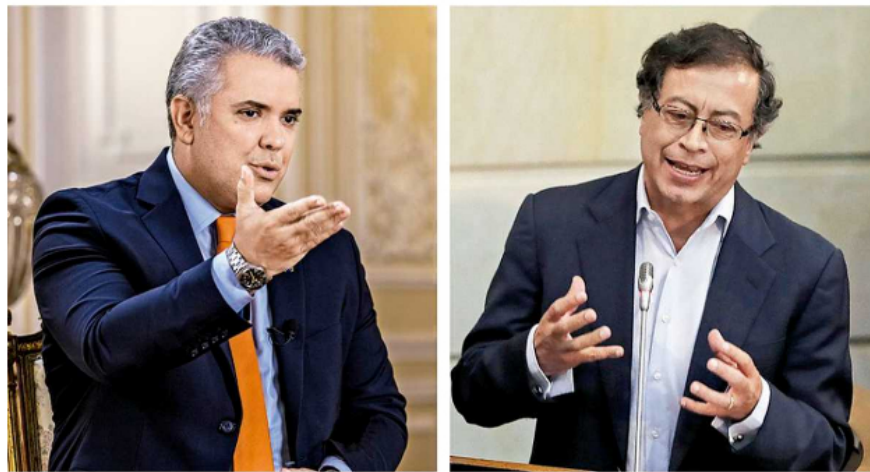
Iván Duque y Gustavo Petro.

El presidente de la República, Iván Duque, le salió al paso a la controversia que se ha desatado en el país con reacciones que se han registrado de diferentes sectores, incluidas las del mandatario electo Gustavo Petro, sobre la composición de la junta de Ecopetrol. Algunos han señalado que los integrantes de la junta están atornillados en los cargos.