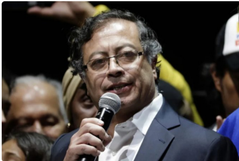
Gustavo Petro, presidente electo de Colombia.

El presidente electo de Colombia, Gustavo Petro, que asumirá el próximo 7 de agosto, advirtió este martes a la petrolera estatal Ecopetrol que seguirá adelante con su plan de hacer una transición energética hacia energías limpias en el país, proyecto que ha causado preocupación en el ámbito económico.